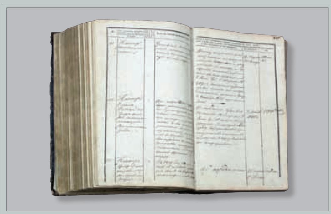
Rusų carinės administracinės valdžios sudaryti sukilėlių sąrašai. 1830–1832 m. Karo muziejaus rinkiniai. Lapas su E. Pliaterytės pavarde.