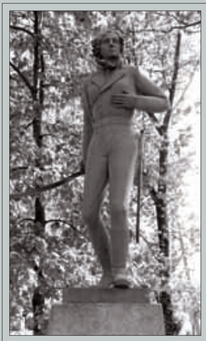
Emilijos Pliaterytės paminklas Kapčiamiesčio aikštėje, 1999 m. Skulptorius A. Ambrulevičius, fotografas L. R. Žiemys, iniciatorius A. Vitkauskas