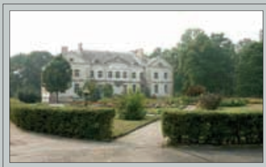
Grafų Pliaterių dvaras Antazavėje