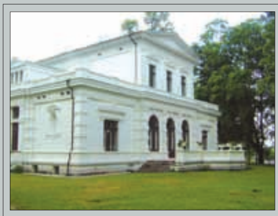
Grafų Pliaterių Švėkšnos dvaras