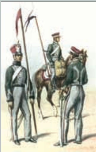
10-asis lietuvių ulonų sukilėlių pulkas. Bronislaw Gembarzewski