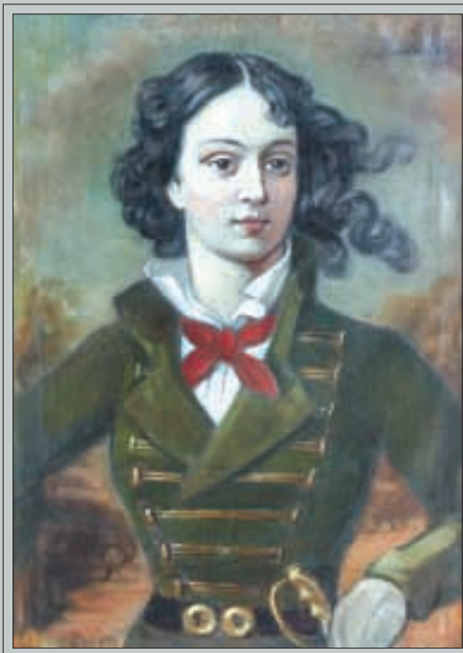
Grafaitė kapitonė Emilija Pliaterytė (1806–1831)