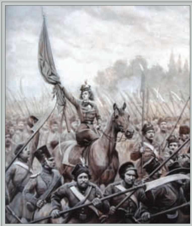
1831 METŲ SUKILIMO DIDVYRĖ GRAFAITĖ EMILJA PLIATERYTĖ