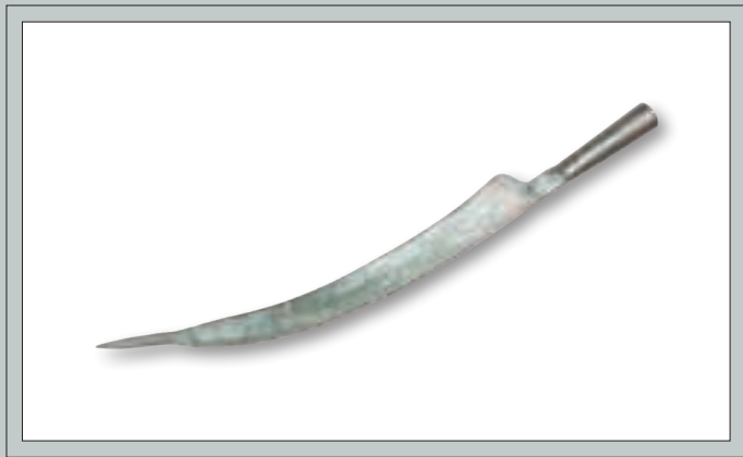
Sukilėlių naudotas dalgis (kopija). VDKM ginklų rinkiniai