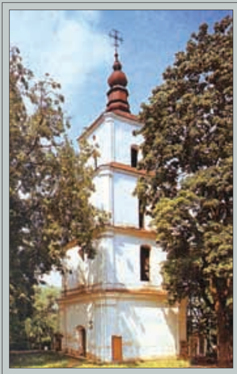
Dusetų bažnyčios varpinė, kurioje sukilėliai slėpė ginklus