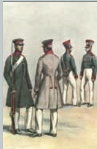
25-asis (1-asis lietuvių pėstininkų pulkas, su kuriuo Emilija Pliaterytė dalyvavo Kauno gynyboje.