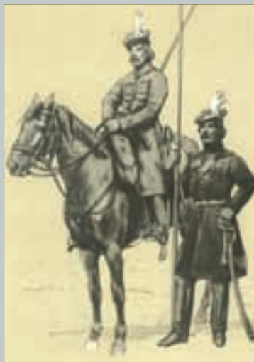
2-asis Augustavo (Užnemunės) sukilėlių raitelių pulkas. Bronislaw Gembarzewski. Wojsko Polskie. Warszawa, 1966