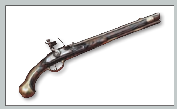
Sukilėlių naudotas prūsiškas pistoletas su titnagine spyna. XVIII a. pab. VDKM ginklų rinkiniai